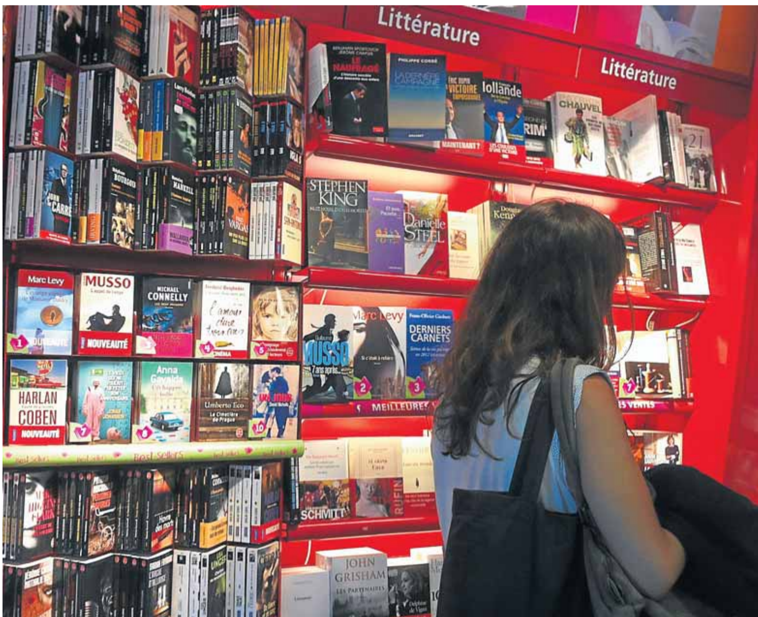
Six librairies locales adhèrent aujourd'hui au réseau mutualiste lalibrairie.com, mais avec encore très peu de retentissement.